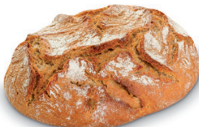
2040 | Žitná placka | 200 g