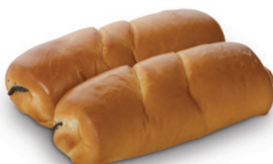
2944 | Špička s náplní makovou 2 ks | B | 220 g 2947 | Špička s náplní tvarohovou 2 ks | B | 220 g