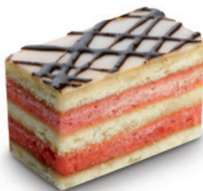
8905 | Řez s punčovou příchutí | 30 g