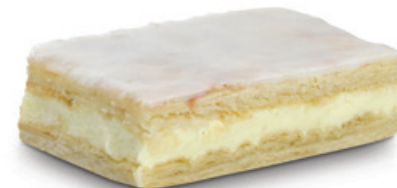
6506 | Listový žloutkový řez | 40 g