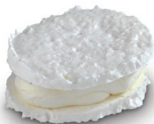
7335 | Laskonka kokosová | 40 g