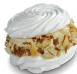
7406 | Sněhová paštika s kávovým krémem | 40 g