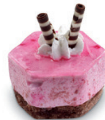
8919 | Miňonka s příchutí malina* | 15 g