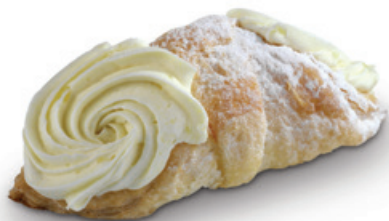
6513 | Listový šáteček se žloutkovým krémem | 50 g