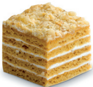
6512 | Medovník | 30 g