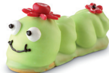
8717 | Housenka s pistáciovou polevou | 55 g