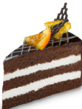
8966 | Dortový řez s tvarohovým krémem | 100 g