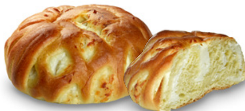
2791 | Růžička s tvarohovou náplní | 70 g