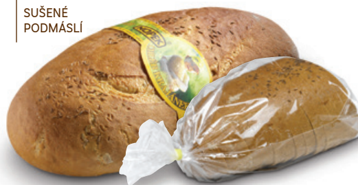
1107 | Chléb Krajánek | 1000 g 1186 | Chléb Krajánek | BK | 480 g