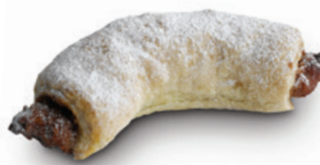
4014 | Listový rohlíček s náplní arašídovou | 40 g