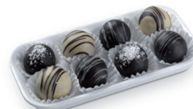
7272 | Fondánové kuličky | B | 150 g