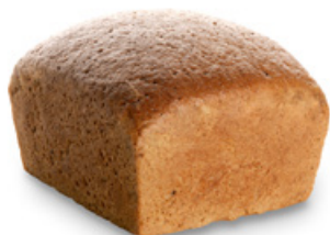
1779 | Celozrnný žitný chléb | 500 g