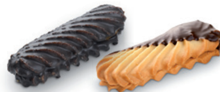
4903 | Linecká třeňá tyčka s ovocnou náplní | 40 g 4903.1 | Linecká třeňá tyčka polomáčená | 40 g