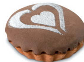
4695 | Svačinka s višňovou náplní | 80 g