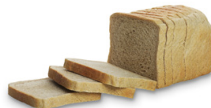
1561 | Toastový chléb tmavý | BK | 180 g 1563 | Toastový chléb tmavý | BK | 400 g