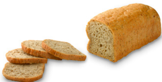
1554 | Chia toast | BK | 400 g