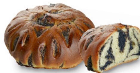
2813 | Růžička s makovou náplní | 70 g