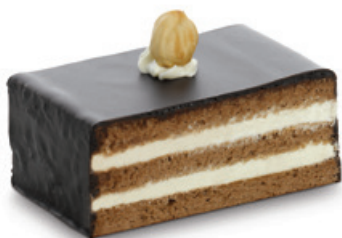
7204 | Oříšková pochoutka | 40 g