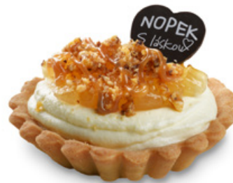
8958 | Tartaletka s hruškovou náplní | 100 g