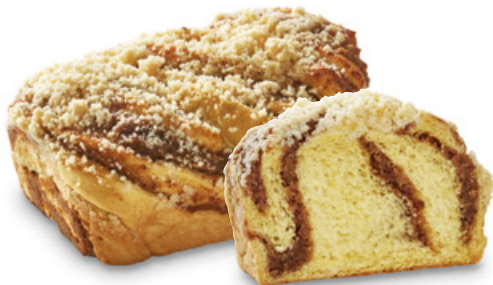
2952 | TWIST s ořechovou náplní | 230 g