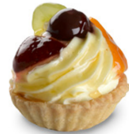
6502 | Linecký košíček s ovocem a žloutkovým krémem | 60 g