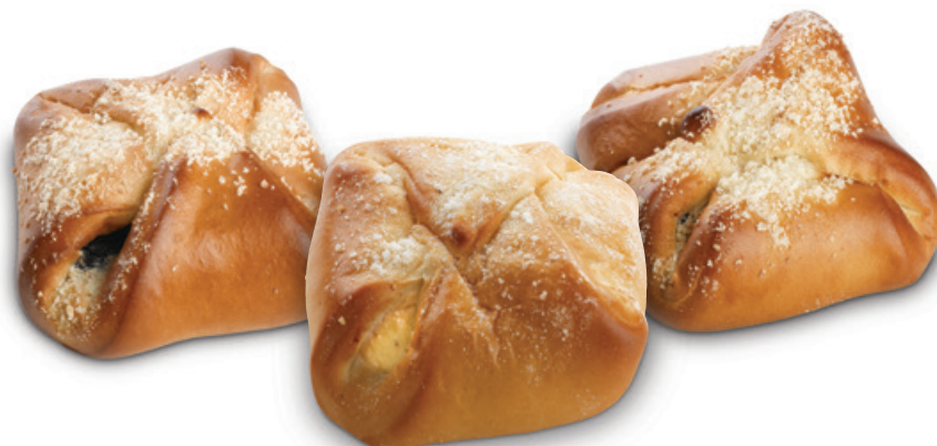
2853 | Koláč vázaný s náplní borůvkovou | 80 g