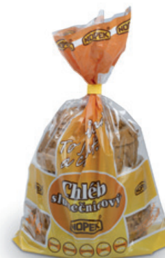
1962 | Chléb slunečnicový 1/2 | BK | 250 g