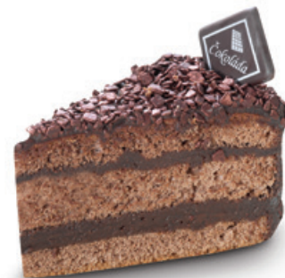
8203 | Dort Scaglietta | 100 g