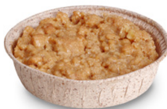
4684 | Crumble | 80 g