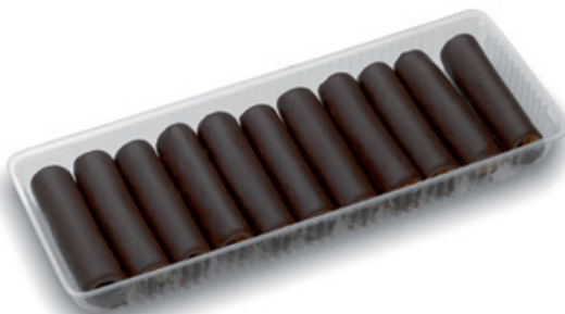
4835 | Griliášové trubičky korpus | B | 170 g 4808 | Griliášová trubička korpus | 17 g