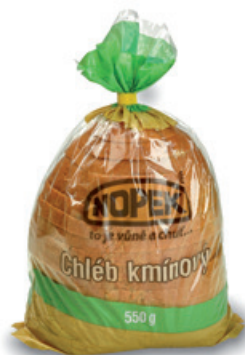
1161 | Chléb kmínový | BK | 550 g