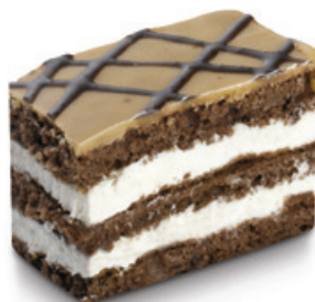
7399 | Mocca řez | 20 g