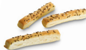
4063 | Listové tyčinky MIX | 1000 g