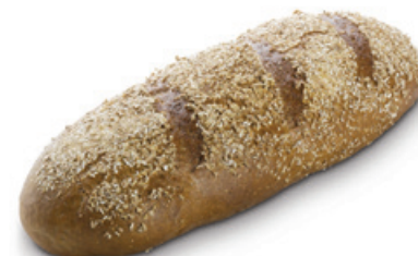
1192 | Bačovský chléb | 500 g