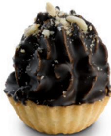
8923 | Linecký arašídový košíček | 60 g