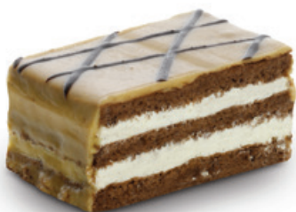
7409 | Mocca řez | 50 g