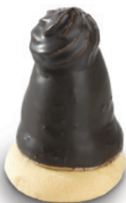
6521 | Špička s náplní | 40 g