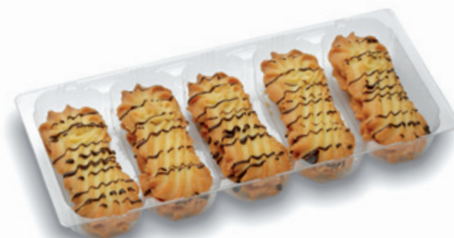
4922 | Linecké třeňé pečivo s náp. 5 ks | B | 140 g