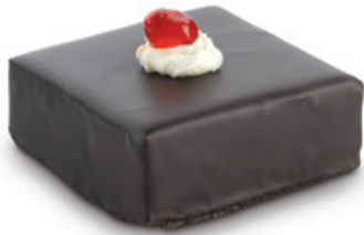
8913 | Kostka s rumovou příchutí | 40 g