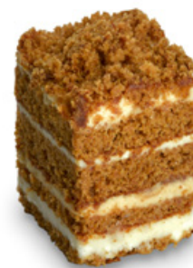
9040 | Řez Mája | 50 g