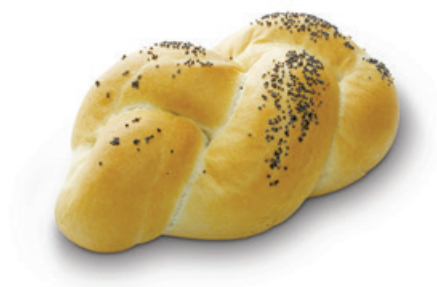
2245 | Pletýnka | 129 g