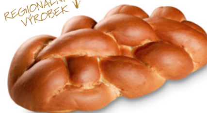
3066 | Vánočka bez rozinek | B | 400 g 3113 | Vánočka bez rozinek | B | 750 g