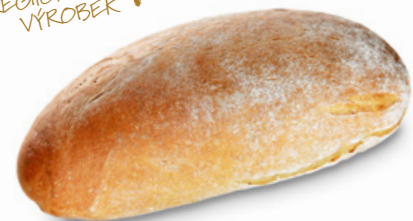
1148 | Chléb kmínový | 600 g