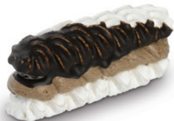
7187 | Banánek sněhový s kakaovým krémem | 40 g