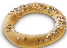
5801 | Preclík | 25 g