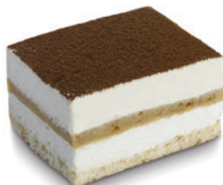
8221 | Řez Tiramisu | 50 g