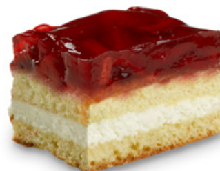
8957 | Jahodový řez | 100 g