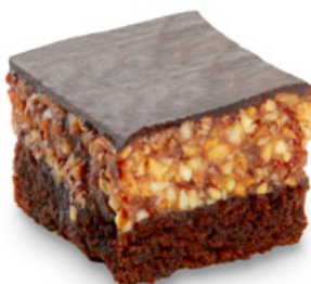
8920 | Snicky řez | 70 g