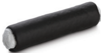
9022 | Jádrová trubička plněná | 20 g