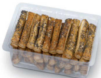
4062 | Listové tyčinky sůl a mák | B | 150 g