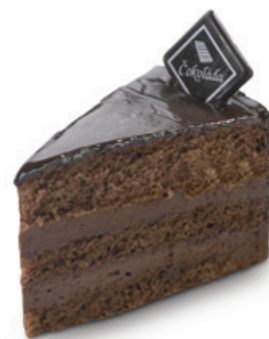
8202 | Dort Cioccolato | 110 g