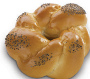
2838 | Makovka | 72 g