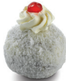
8975 | Kokosová koule | 60 g