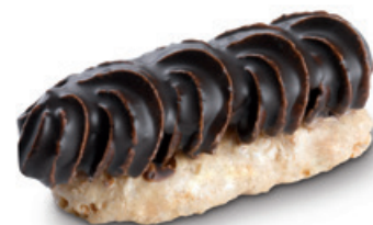
8204 | Pařížská tyčka | 20 g