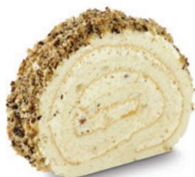
7290 | Ořechová roláda | 40 g