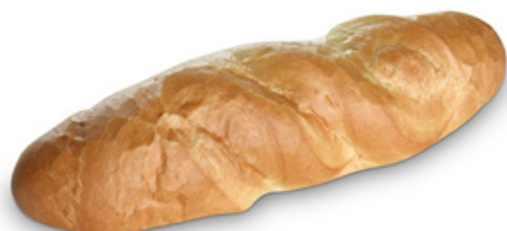
2226 | Bageta | 110 g