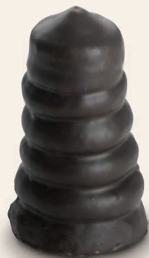
8712 | Indián MAX | 50 g