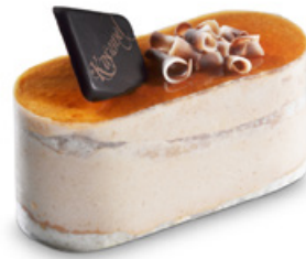
38261 | Joy karamel | 80 g