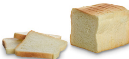
1550 | Toastový chléb | BK | 180 g 1552 | Toastový chléb | BK | 400 g