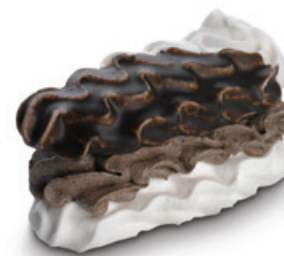
7186 | Banánek sněhový s kakaovým krémem | 15 g