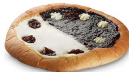
3142 | Chodský tlačeneý koláč | B | 200 g