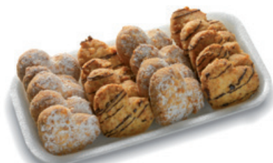
4946 | Čajová kokosová srdíčka mini | B | 100 g