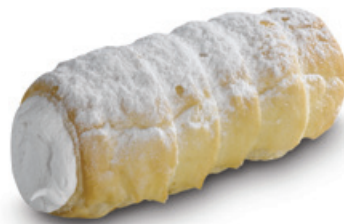
8706 | Listová trubička plněná | 30 g