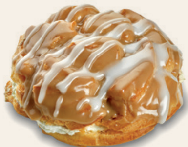
8989 | Větrník karamelový MAX | 130 g