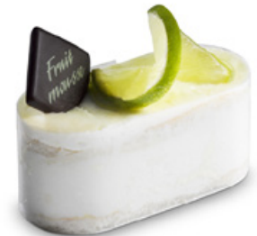
38262 | Joy tvaroh a limetka | 80 g