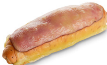
2708 | Anglický chiaspitz | 95 g