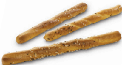
5820 | Tyčinky pochoutkové | B | 100 g