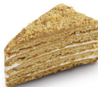
6509 | Medovník | 65 g