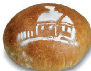
1136 | Chléb Chalupář | 500 g