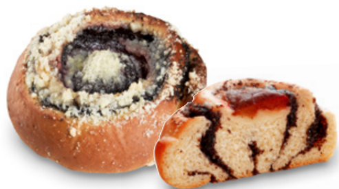
2841 | Selský makový koláč se švestkou | 90 g