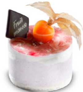
38265 | Joy tvaroh a černý rybíz | 80 g