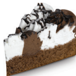
8222 | Dort Harlekýn | 50 g