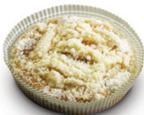
4687 | Třený koláček s meruňkami | 90 g 4688 | Třený koláček se švestkami | 90 g