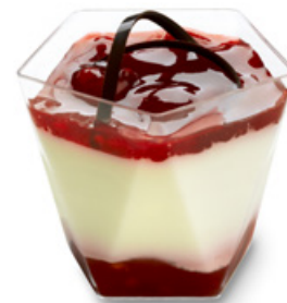
8971 | Panna cotta pohárek | 110 g