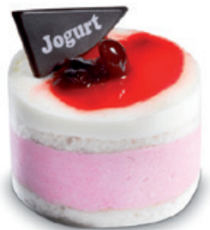
38263 | Joy jogurt a višň | 80 g