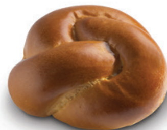
2856 | Jidáš | 86 g