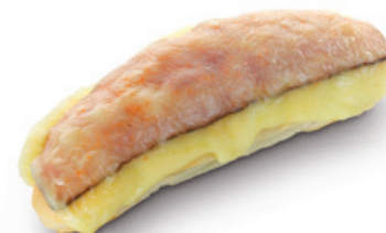
2709 | Anglický rohlík | 80 g