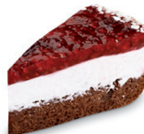
9038 | Malinový dortový řez | 95 g