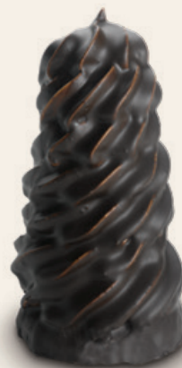
8713 | Indián ovocný MAX | 50 g