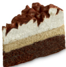
8962 | Řez cafe latte | 100 g