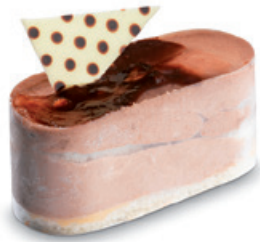
38260 | Joy nociollina | 80 g