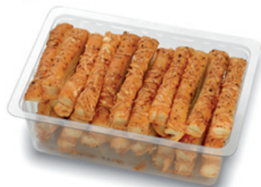
4064 | Listové tyčinky se sýrem | B | 150 g