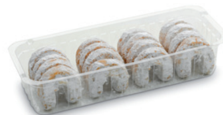
4947 | Vaflové rohlíčky obalované mini | B | 110 g