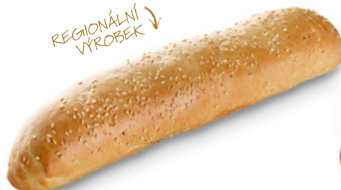
2266 | Bageta | 130 g