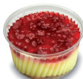
8991 | Pudink s malinami | 200 g