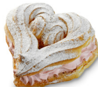
8978 | Srdcovka | 70 g