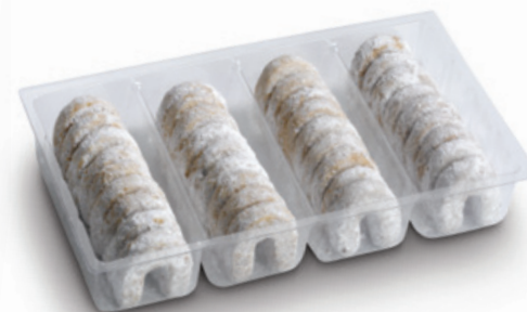
4949 | Vaflové rohlíčky obalované | B | 250 g