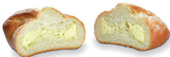
2892 | Koláč vázaný s náplní tvarohovou | 60 g