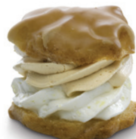
8258 | Větrník karamelový | 30 g