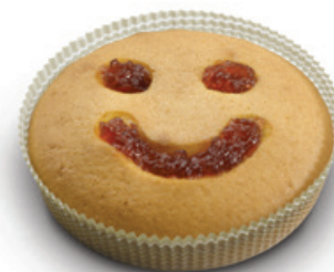
4685 | Smajlík | 90 g