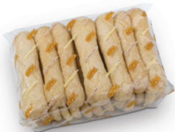
6103 | Piškoty cukrářské | B | 150 g