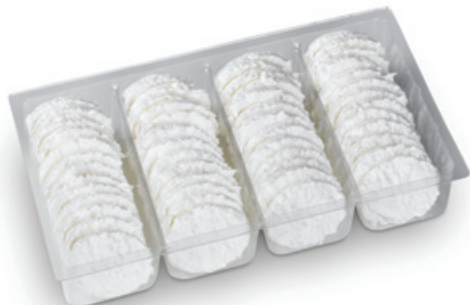
4825 | Laskonky korpus | B | 150 g 4848 | Laskonky korpus | 1000 g