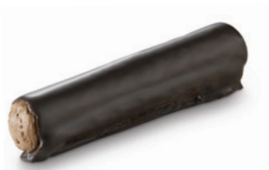
8201 | Jádrová trubička s pařížskou šlehačkou | 25 g