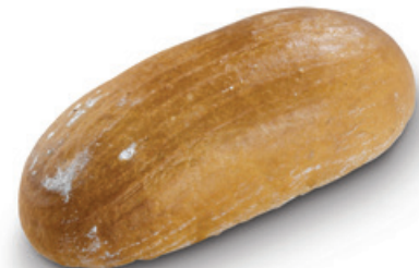
1122 | Chléb kmínový | 500 g