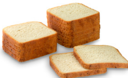
1555 | Super sendvič | BK | 550 g

CELOZRNNÁ ŽITNÁ MOUKA, SLUNEČNICE, ROSTLINNÉ VYHONKY