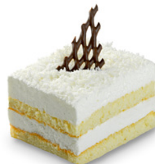
8280 | Kokosový řez | 50 g