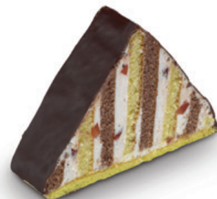
7198 | Střecha | 60 g