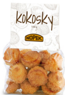
4836 | Kokosky korpus | B | 150 g 4844 | Kokosky korpus | 1000 g