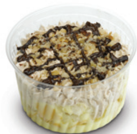
8998 | Mls oříškový | 100 g