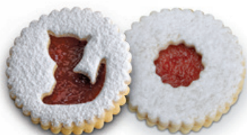
4914 | Linecký koláček | 50 g 4915 | Linecký koláček 2 ks | B | 100 g