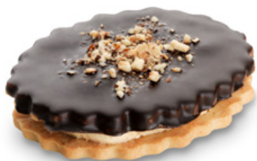
7495 | Špaldový oválek s karamelovým krémem | 70 g