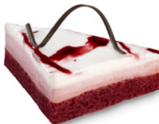
8299 | Ostružinový řez | 80 g