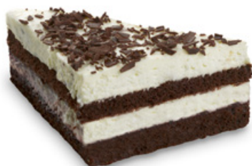
8247 | Schwarzwald řez | 90 g