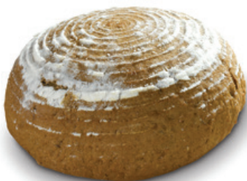
1139 | Chléb kmínový kulatý | 800 g