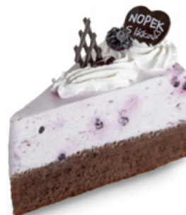
8941 | Borůvkový dort s jogurtem | 80 g