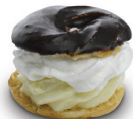
8987 | Věneček se žloutkovou náplní a tmavou polevou | 20 g