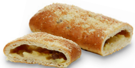
2808 | Cereální štrudlík s jablečnou náplní | 80 g

CEREÁLNÍ SMĚS SE SLUNEČNICÍ, LNEM A PŠENIČNÝMI OTRUBAMI