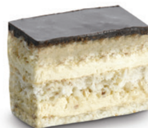
7400 | Štafetka | 20 g