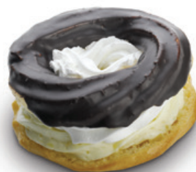
9029 | Věneček se žloutkovou náplní a tmavou polevou | 50 g