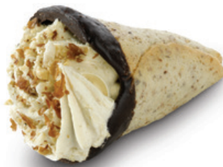
7405 | Jádrový kornoutek | 40 g