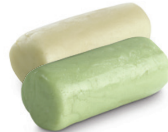
0821 | Mléčná modelovací hmota | B | 100 g