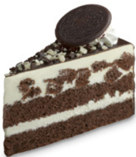
8922 | Řez oreo | 95 g