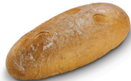
1140 | Chléb kmínový | 800 g