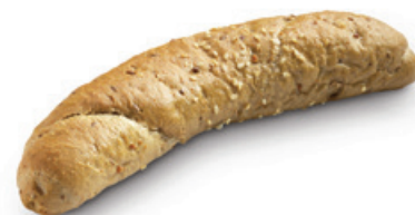
2332 | Vita rohlík | 60 g