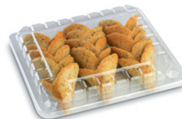
4828 | Jádrové kornoutky korpus mini | B | 75 g