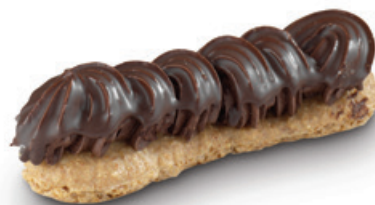
8206 | Pařížská tyčka | 40 g