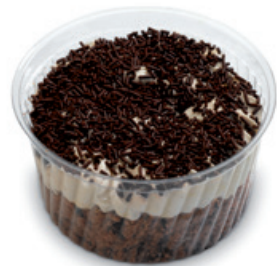
8999 | Mls kávový | 100 g