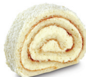
7193 | Kokosová roláda | 50 g