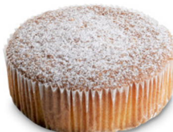
4482 | Babeta | B | 225 g