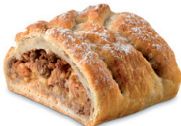
4094 | Listový závin s jablekly | 100 g