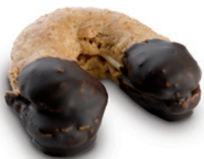
7154 | Jádrový rohlíček s likérovou příchutí | 20 g