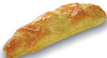
2231 | Rohlík se sýrem | 60 g