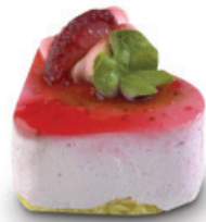
8595 | Miňonka s příchutí jahoda* | 15 g