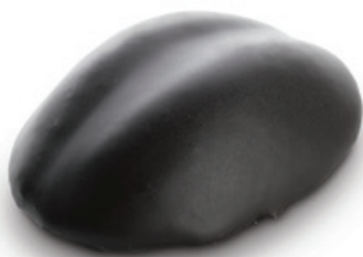
0820 | Griliášové zrno | 30 g