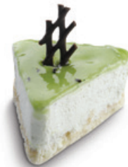
8596 | Miňonka s příchutí kiwi* | 15 g