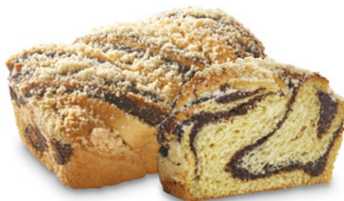
2953 | TWIST s makovou náplní | 230 g