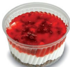
8992 | Mls malinový | 120 g