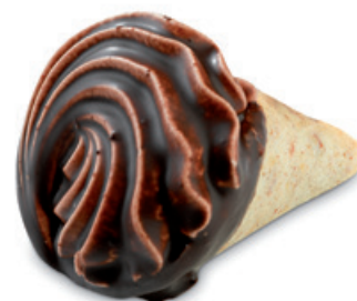
8724 | Kornoutek s ovocnou náplní | 15 g