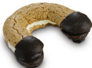
7414 | Jádrový rohlíček s likérovou příchutí | 40 g