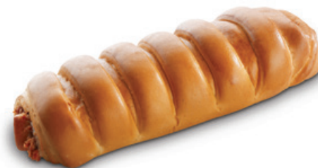
2980 | Závín s náplní makovou | B | 280 g 3151 | Závín s náplní tvarohovou | B | 280 g 3075 | Závín s náplní makovou | B | 400 g 3249 | Závín s náplní tvarohovou | B | 400 g