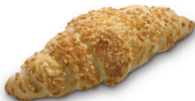
4202 | Plundrový rohlík se sýrem a sezamem | 40 g