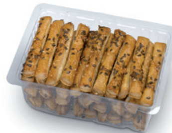
4059 | Listové tyčinky pikant | B | 150 g