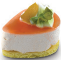
8916 | Miňonka s příchutí meruňka* | 15 g