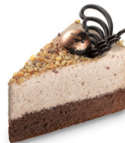
9034 | Nocciola dort | 80 g