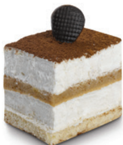
8597 | Řez Tiramisu | 25 g