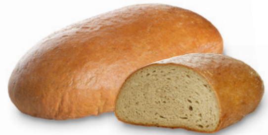
1111 | Chléb kmínový | 1200 g 1112 | Chléb kmínový | 1200 g 1113 | Chléb kmínový | 1200 g