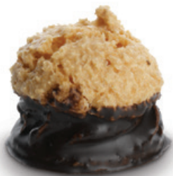
7402 | Kokoska plněná | 20 g