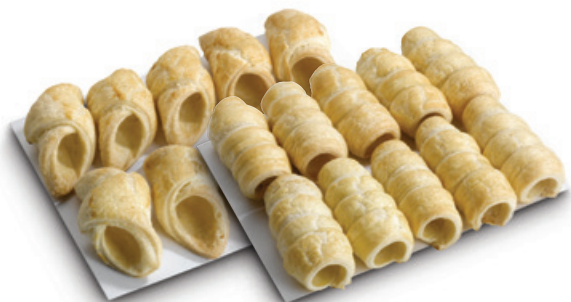
4060 | Listové šátečky korpus | B | 150 g 4000 | Listový šáteček korpus | 15 g 4078 | Listové trubičky korpus | B | 200 g 4001 | Listová trubička korpus | 20 g