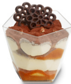
8274 | Tiramisu pohárek | 80 g