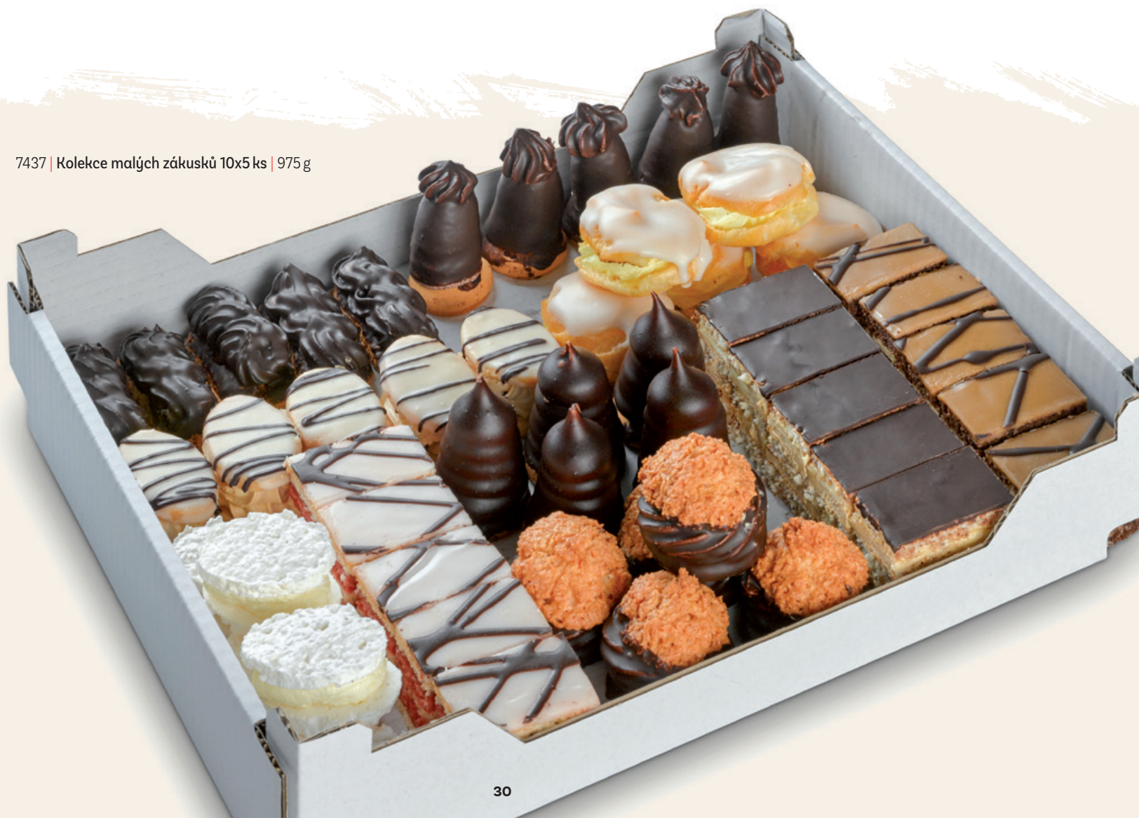
7437 | Kolekce malých zákusků 10x5 ks | 975 g