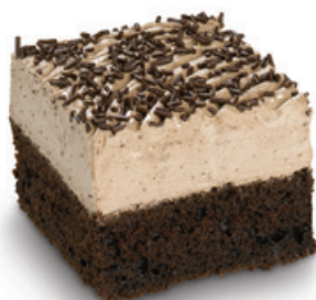
8961 | Řez Kominíček | 50 g