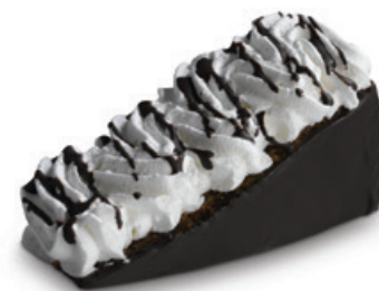
8248 | Sachr dort se šlehačkou | 70 g