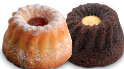
4880 | Bábovička s náplní rybízovou | 70 g 4881 | Bábovička s náplní koňak. př. | 70 g 4882 | Bábovička s čoko chipsy | 70 g