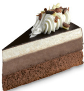
8240 | Pařížský dort | 65 g