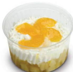
8996 | Mls mandarinka | 120 g