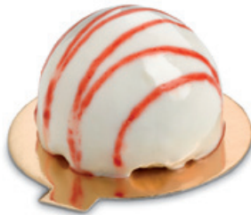
38266 | Joy jahoda | 120 g