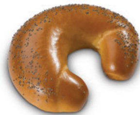
2769 | Rohlík sladký | 43 g