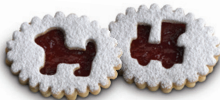
4917 | Máslový špaldový oválek | 50 g