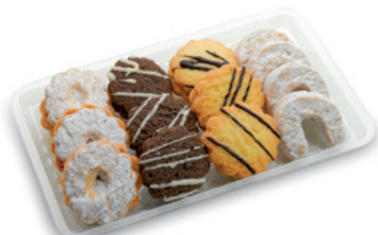
4968 | Čajové pečivo 4 druhy mini | B | 150 g