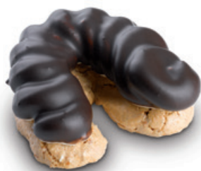
7415 | Jádrový rohlíček s karamelovým krémem | 20 g