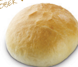
2346 | Pečivo bulka | 86 g