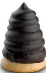
8707 | Indiánek krémový s tmavou polevou | 30 g