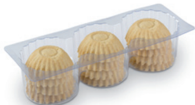
4703 | Linecké košíčky korpus | B | 100 g 4700 | Linecký košíček korpus | 10 g