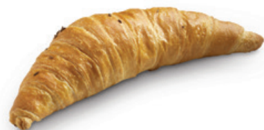
4228 | Plundrový karlovarský rohlík | 40 g