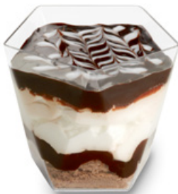
8297 | Míša pohárek | 100 g