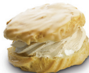
8959 | Větrník karamelový | 100 g