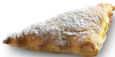
4008 | Listový trojhránek s náplní jablekovou | 40 g 4021 | Listový trojhránek s náplní tvarohovou | 40 g