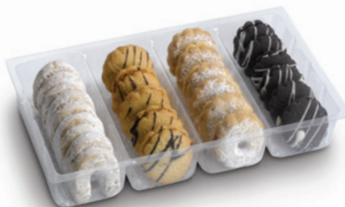
4969 | Čajové pečivo 4 druhy | B | 300 g 4986 | Čajové pečivo 4 druhy | 1000 g