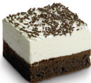
8960 | Řez Polárka | 50 g