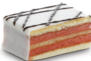
8928 | Řez s punčovou příchutí | 60 g