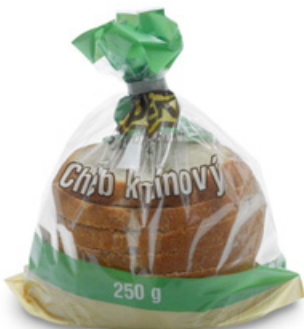
1155 | Chléb kmínový | BK | 250 g