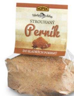
5528 | Strouhaný perník | B | 200 g