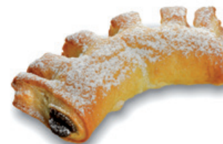
4020 | Listový rohlíček s náplní makovou | 40 g