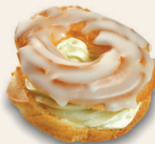
6585 | Věneček se žloutkovou náplní MAX | 70 g