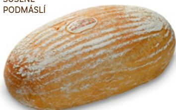
1106 | Chléb Krajánek | 500 g