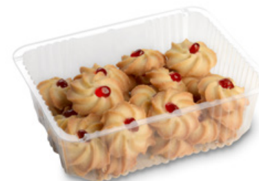
4929 | Čajové třené růžičky | B | 200 g