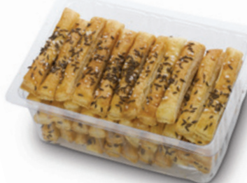
4061 | Listové tyčinky sůl a kmín | B | 150 g