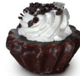
9050 | Žloutkový košíček s náplní | 30 g