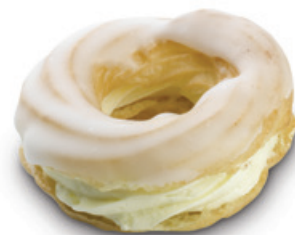
6584 | Věneček se žloutkovou náplní | 40 g