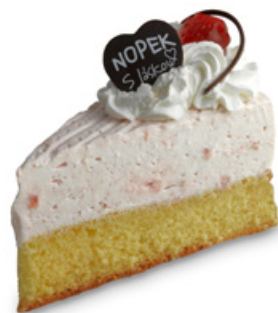
8940 | Jahodový dort s jogurtem | 80 g