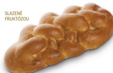
3705 | Vánočka Diana | B | 360 g 3707 | Vánočka Diana | BK | 360 g