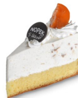
9032 | Meruňkový dort s jogurtem | 80 g