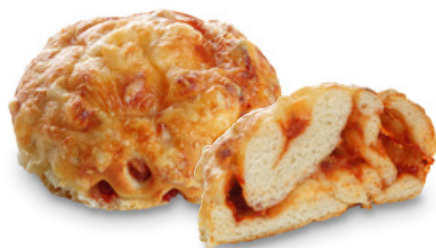
2717 | Růžička PIZZA | 85 g