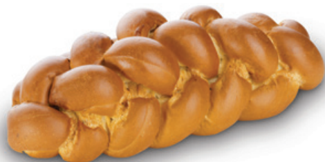
2939 | Vánočka s rozinkami | B | 200 g 3069 | Vánočka s rozinkami | B | 400 g 3070 | Vánočka s rozinkami | BK | 400 g