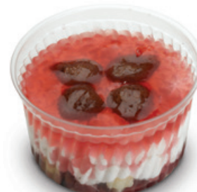
8997 | Mls jahodový | 120 g