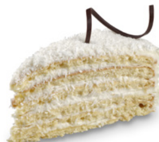
8232 | Kokosový dort | 100 g