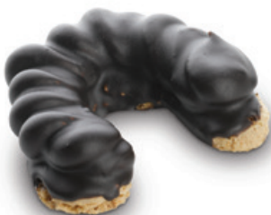
7180 | Jádrový rohlíček s karamelovým krémem | 40 g