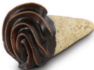
8709 | Kornoutek s ovocnou náplní | 30 g