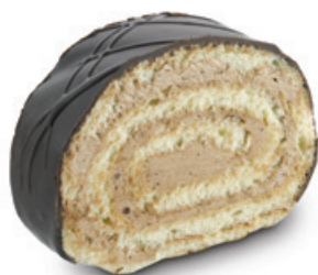
7177 | Roláda piškotová s polevou | 40 g