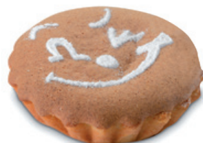
4694 | Svačinka s meruňkovou náplní | 80 g