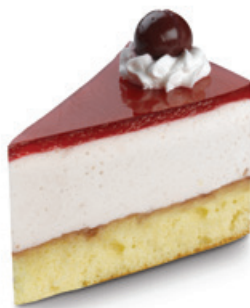
8927 | Písecký dort | 70 g