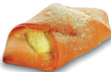
2874 | Šáteček s náplní tvarohovou | 60 g