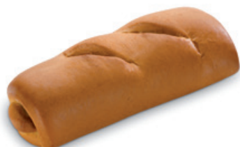
2943 | Špička s náplní makovou | B | 110 g 2946 | Špička s náplní tvarohovou | B | 110 g