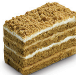
9035 | Řez Mája | 100 g