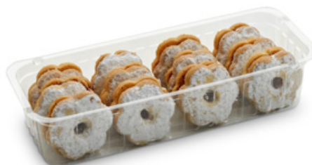
4971 | Linecké pečivo s ovocnou náplní mini | B | 150 g