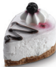
8918 | Miňonka s příchutí borůvka* | 15 g