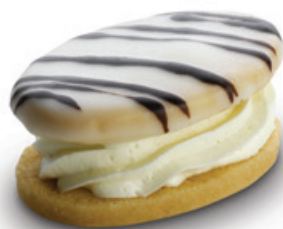
7244 | Linecký oválek s kávovým krémem | 20 g