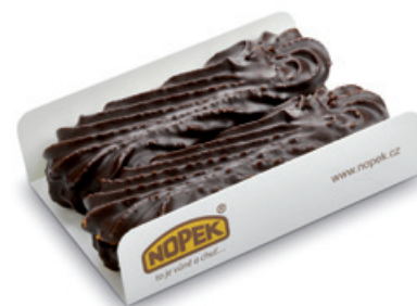
4911 | Linecké třeňé tyčky s ovocnou náp. 2 ks | B | 80 g