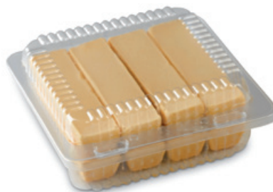
4425 | Vaničky korpus | B | 130 g 4400 | Vanička korpus | 13 g