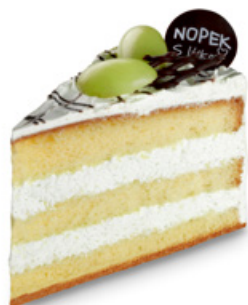
8244 | Dortový řez s příchutí pistácie | 100 g