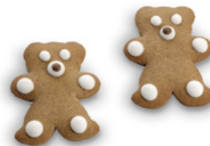
5523 | Perník Medvídek | 20 g