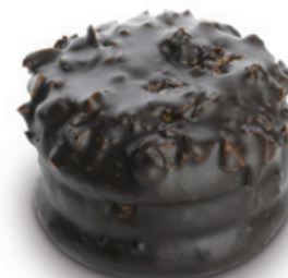
7197 | Pražská koule | 50 g