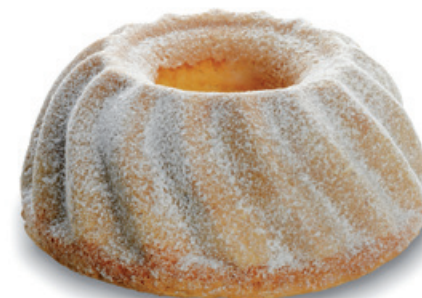
4492 | Piškotová bábovka | B | 400 g