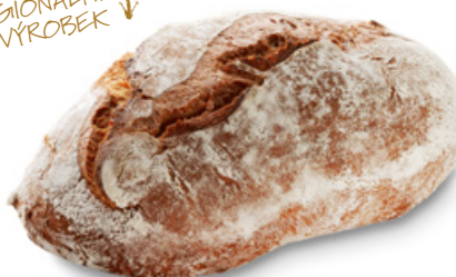
1062 | Chléb žitnopseničný | 800 g