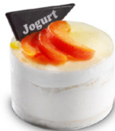
38264 | Joy meruňka a jogurt | 80 g