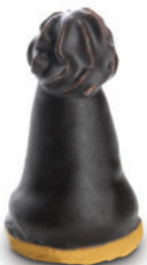
6544 | Špička s náplní | 20 g