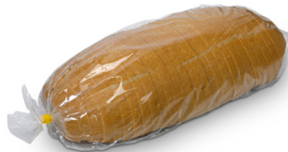
1174 | Chléb kmínový | BK | 1180 g