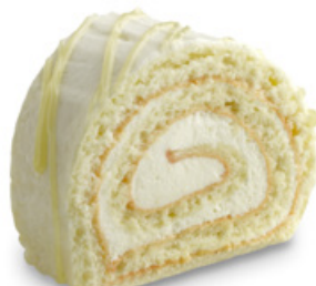
8246 | Roláda s citronovou příchutí | 75 g