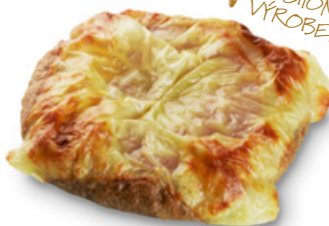
2815 | Cereální PIZZA | 70 g