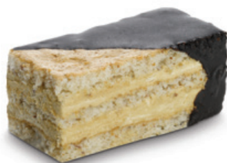
7194 | Štafetka | 50 g