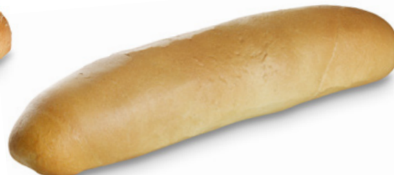
2302 | Veka | 360 g 2303 | Veka B | 360 g 2304 | Veka BK | 360 g