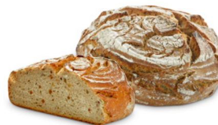
1024 | Škvarkový chléb | 400 g