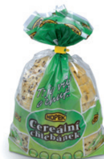
1961 | Cereální chlebaněk 1/2 | BK | 250 g