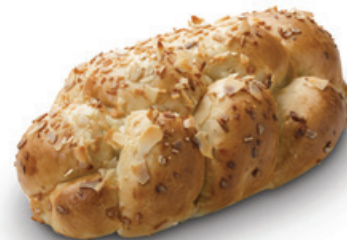
2882 | Sladká raženka | 90 g