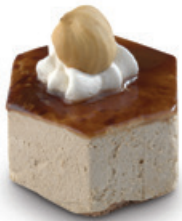
8592 | Miňonka s příchutí oříšek* | 15 g