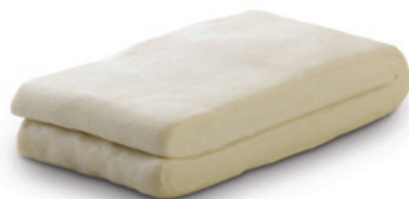
9255 | Listové těsto | B | 500 g