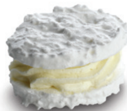
7150 | Laskonka kokosová | 15 g