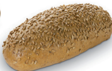
1931 | Chléb slunečnicový | 500 g 1768 | Chléb slunečnicový | BK | 500 g