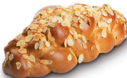
3085 | Vánočka s rozinkami a mandlemi | B | 400 g