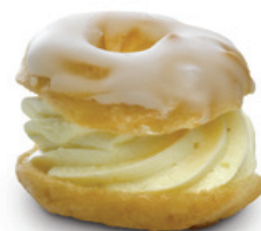
6528 | Věneček se žloutkovou náplní | 15 g