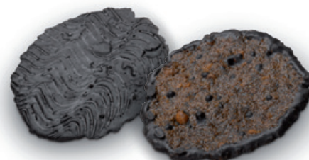
4817 | Marokánky 2 ks | B | 80 g 4810 | Marokánka | 40 g