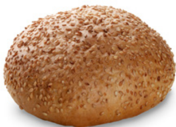
2240 | Bulka hamburger | 100 g