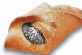
2875 | Šáteček s náplní makovou | 60 g