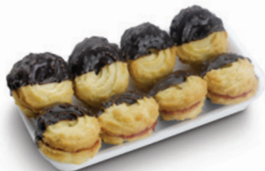
4921 | Linecké tšené polomáčené mini | B | 160 g