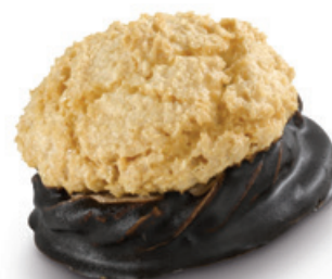
7410 | Kokoska plněná | 50 g