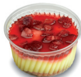
8990 | Pudink s jahodami | 200 g