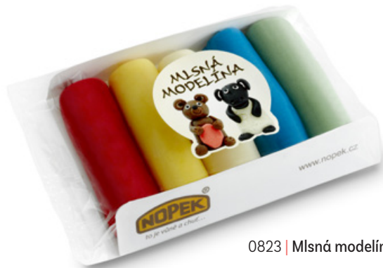
0823 | Mlsná modelína | B | 150 g